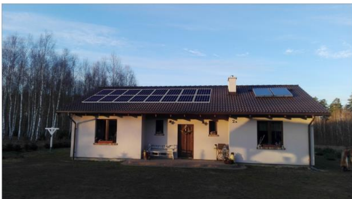
Rys 1. WIZUALIZACJA INSTALACJI FOTOWOLTAICZNEJ BRZEZINIEC 2B